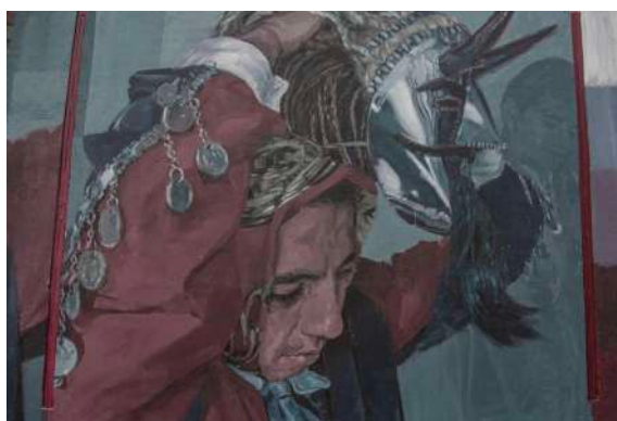
Detalle del mural realizado por Pablo Astrain en noviembre de 2021 en la ciudad de Riobamba (Ecuador) en su participación en la quinta edición del Festival Nuevo Mural.

Su obra se caracteriza por las influencias del arte callejero que le han llevado a tener un estilo que él mismo define como «hiperrealismo narrativo».