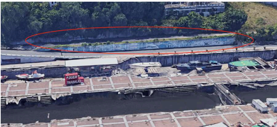
Ubicación del mural del Centenario de la BOS